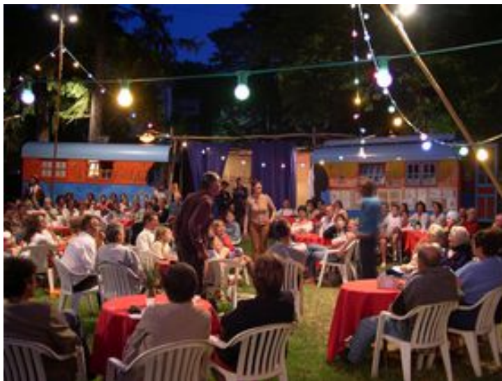
“Kvetch” par la Cie Eolie Songe

De nombreux partenaires, publics, comme privés ont réitéré leur soutien au Cabaret Mobile, et de nouveaux sont venus les rejoindre. Les mairies des différents villages traversés ont vraiment « joué le jeu » pour nous accueillir, et ont ainsi participé à la dynamique générale de l'événement. Les partenaires publics ont appuyé le Cabaret Mobile grâce à des subventions . Les partenaires privés ont également participé activement à la réalisation du projet, en apportant notamment des avantages en nature : prêts de matériel, nourriture... Le fait de mettre en place un partenariat avec les associations locales a permis de créer une dynamique constructive , et de développer des relations sur la durée. Une collaboration a été mise en place avec : Radio M et Radio Sound System dans le cadre de Radio roulotte, le Galop du Roubion pour son spectacle équestre, le Collège Europa pour une création avec 40 jeunes, la Cie Eolie Songe qui est venue présenter en avant première sa création pour Lille 2004 (Capitale Européenne de la culture).